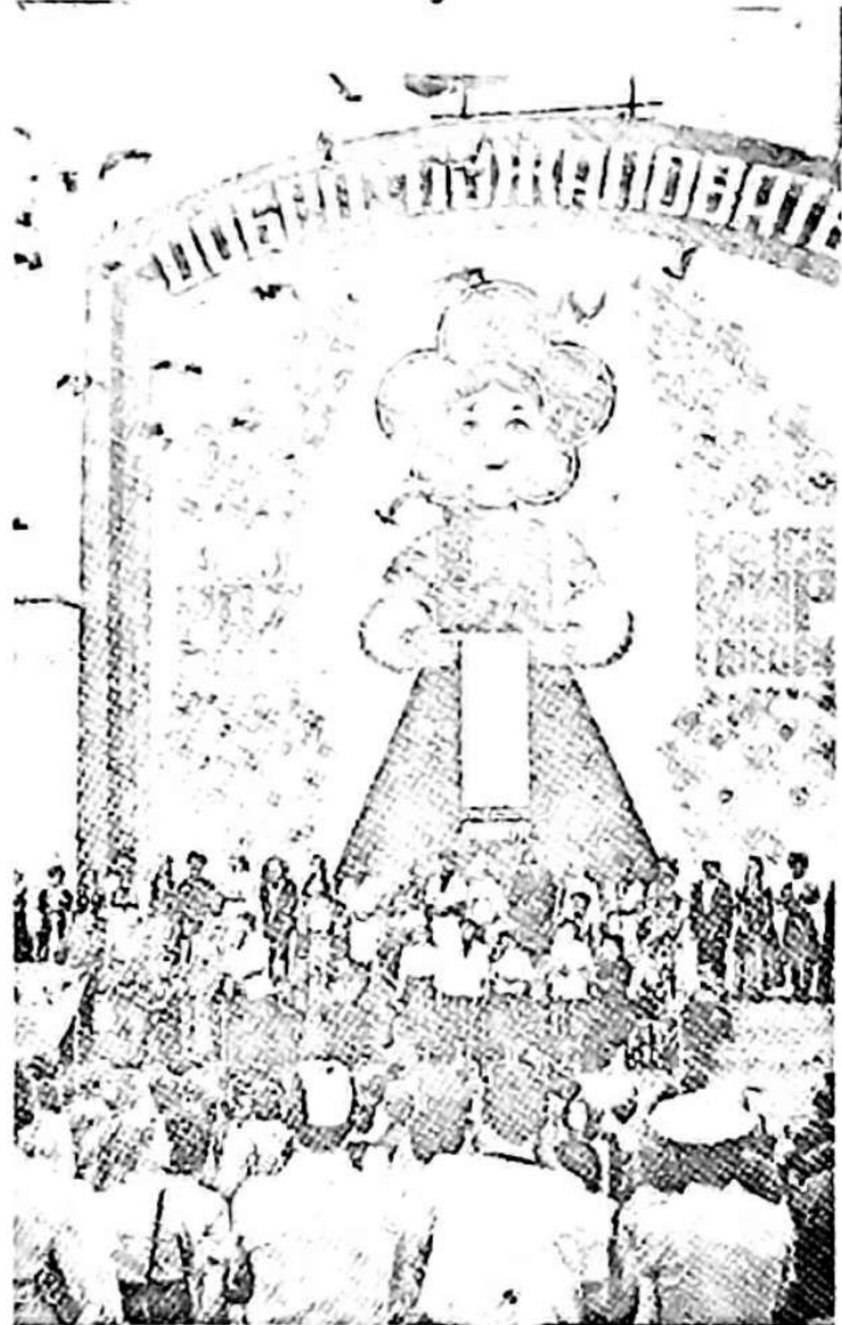
МОСКВА. Кәнчләрип вә тәләбәләриниң XII Үмумдүңја фестивалы. Шәкилдә: «Коломенскоје» Москва Дөвләт горуг-музејиндә бөјүк Бейнәлхалг фолклор бајрамының ачылышы.

Јухарыдан ашагы: 1. М. Ф. Ахундовун «Һекајәти-мүсјә Жор- дан һәкинн-кәбатат вә дәрвиш Мәс- тали шаһ чадүкүнү-мәшһур» эсә- риндә сурәт. 2. Азәрбајчан шаири, Фүзули әдәби мәктәбинниң давамчы- сы. 3. Ч. Чаббарлының эсәри. 4. Үс- лүб фигураларындан бири. 7. Бақы- да нәшр едилмиш сатирик журнал. 8. Азәрбајчан ССР-дә шәһәр. 9. Грамматиканың осас шөбәләриниң дән бири. 10. Дахил олдуглары чүмлә илә грамматик чәһәтдән әлв гәси олмајан мүстәғил чүмләләр. 14. М. С. Ордубәдинниң пјеси. 15. Көркәмли Азәрбајчан сәркәрдәси вә сјјаси хәдими. 18. А. С. Пушкн- һиң «Јевкени Онекин» эсәриндә су- рәт. 21. С. Рүстәмиң «Калди кедәр» комедијасында сурәт. 22. Кәнд тә-